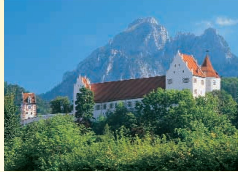
荷尔城堡 (Hohes Schloss) 位于非森老城的中央

和新天鹅堡相比旧天鹅堡 (Hohenschwangau) 虽同样闻名，但其可供人观赏之处却不逊于新天鹅堡。其中最特别的是建于十九世纪的毕德麦耶尔式设计和天鹅湖公园 (Schwansee Park) 这是每个旅游计划中不可忽略的观光景点。