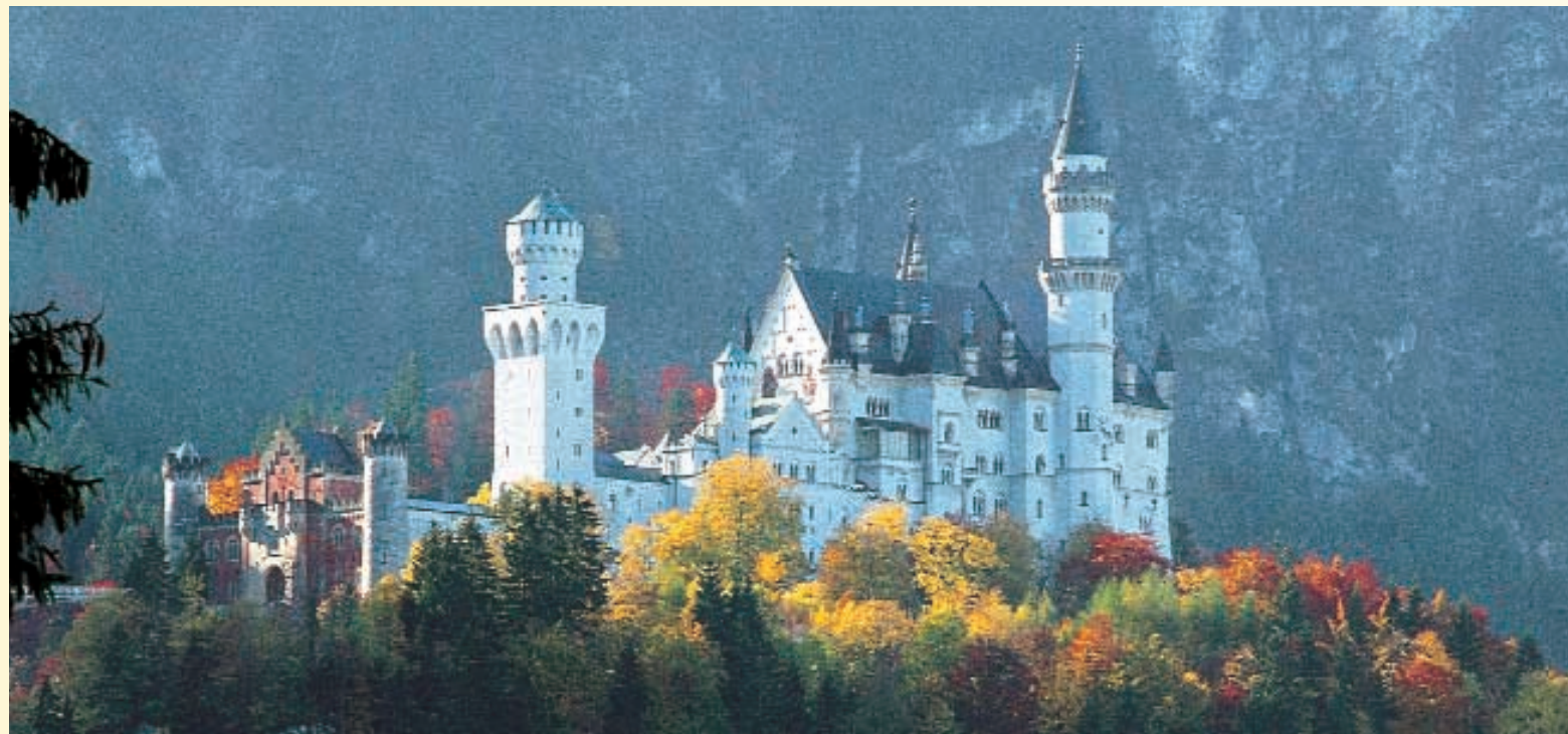
新天鹅堡坐落在闻名遐迩的托拉特峡谷 (Pöllat-schlucht) 之上，距非森四公里