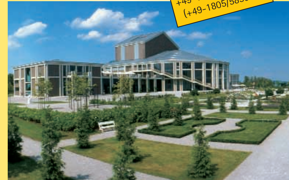
位于弗根湖畔 (Förggensee) 的新天鹅堡歌剧剧院(模型)

Hotline +49-1805/ L.U.D.W.I.G (+49-1805/583944)