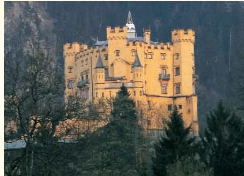
童话王国的皇家儿童城堡-旧天鹅堡仅距非森一公里