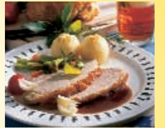
巴伐利亚州地方名菜：肉配土豆丸子和啤酒。